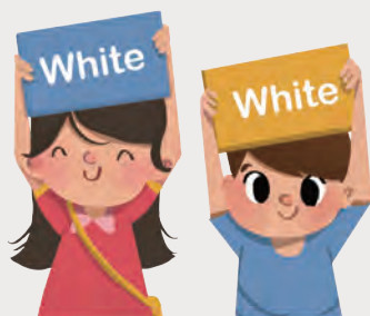
This or That

遠距視訊課程讓每個老師和學生的臉一目瞭然，透過簡單形容同學的外觀特徵，讓其他人猜猜這是誰？同時練習口說，又增加學生之間的互動和參與感！