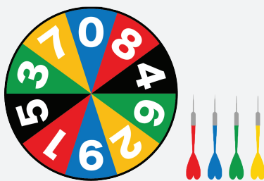
[Set a Goal]